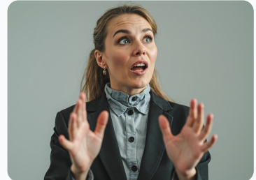
Treinamento e prática: pilares da comunicação eficaz.

Perspectiva histórica: Na Grécia Antiga, a habilidade de falar em público era essencial para a participação na vida política e democrática. Filósofos como Aristóteles dedicaram-se ao estudo sistemático da retórica, buscando compreender os mecanismos que tornam um discurso persuasivo.