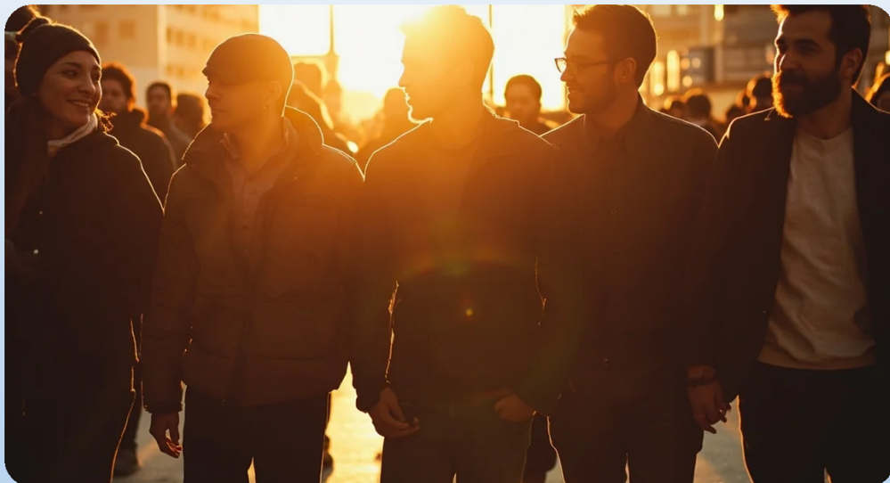
Imagem: Comunicação e liderança em equipe