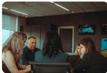
Comunicação em ambiente profissional

A comunicação não deve ser compreendida apenas como um processo de transmissão de informações, mas como um fenômeno complexo que envolve interpretação, negociação de significados e construção coletiva de conhecimento.