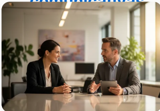
Prática e aprimoramento contínuo

As competências relacionadas à oratória e à comunicação não surgem de forma espontânea, mas resultam de processos contínuos de aprendizagem e prática. O aprimoramento envolve o desenvolvimento de diferentes aspectos, como organização do pensamento, domínio da linguagem, controle da voz e consciência da linguagem corporal.