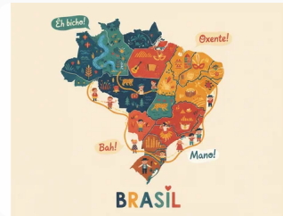
Liderança participativa e diálogo

Por meio da comunicação clara e estruturada, o líder consegue transmitir objetivos, orientar ações e mobilizar equipes em direção a metas comuns.